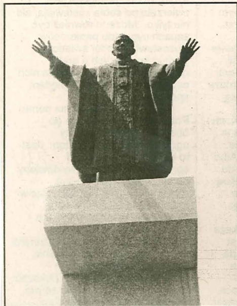
Pomnik Jana Pawła II w Hamtramck.